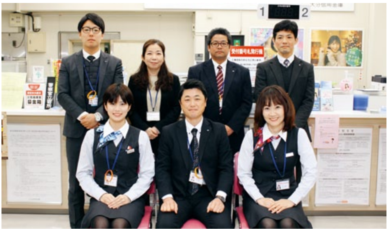
西大分支店の皆さん

自信と誇りを持って全員が活躍できる店舗を目指す! ～お客様の夢を実現するため、全力で信用金庫に徹する～