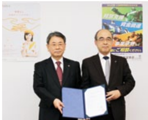
南九州税理士会大分県連合会 北迫会長（左） 当協会 日高会長（右）