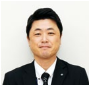
大分信用金庫 西大分支店 支店長