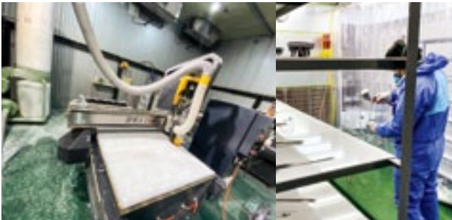
削り出した部品に手作業で塗装を施して仕上げる

樹脂文字は複雑な加工が可能で、魅力的な製品ですが機械設備とそれを扱う社員のスキルも必要なため新規参入は難しい製品です。自社製造が困難な企業は少なくありませんからそうした先に営業を行うことで、互いに利益を得られる関係を築けると考えています。