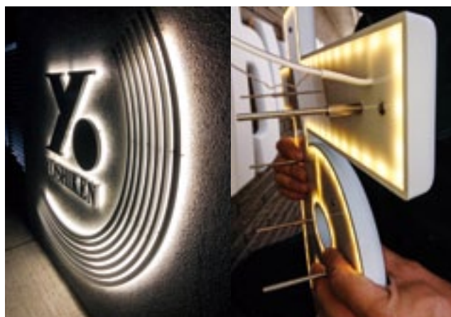
「スピンエッジ」の商品

「スピンエッジ」は樹脂や人工大理石などの素材から削り出しで立体的な看板を作成する我が社のブランドです。従来の金属文字では表現が出来なかった丸みのある滑らかな造形や、小さな文字を光らせることが可能です。また、塗装やカッティングシートなどを用いた表面仕上げなど、構造・発光方法など従来の看板とはデザインなどが大きく異なるものが作成可能です。