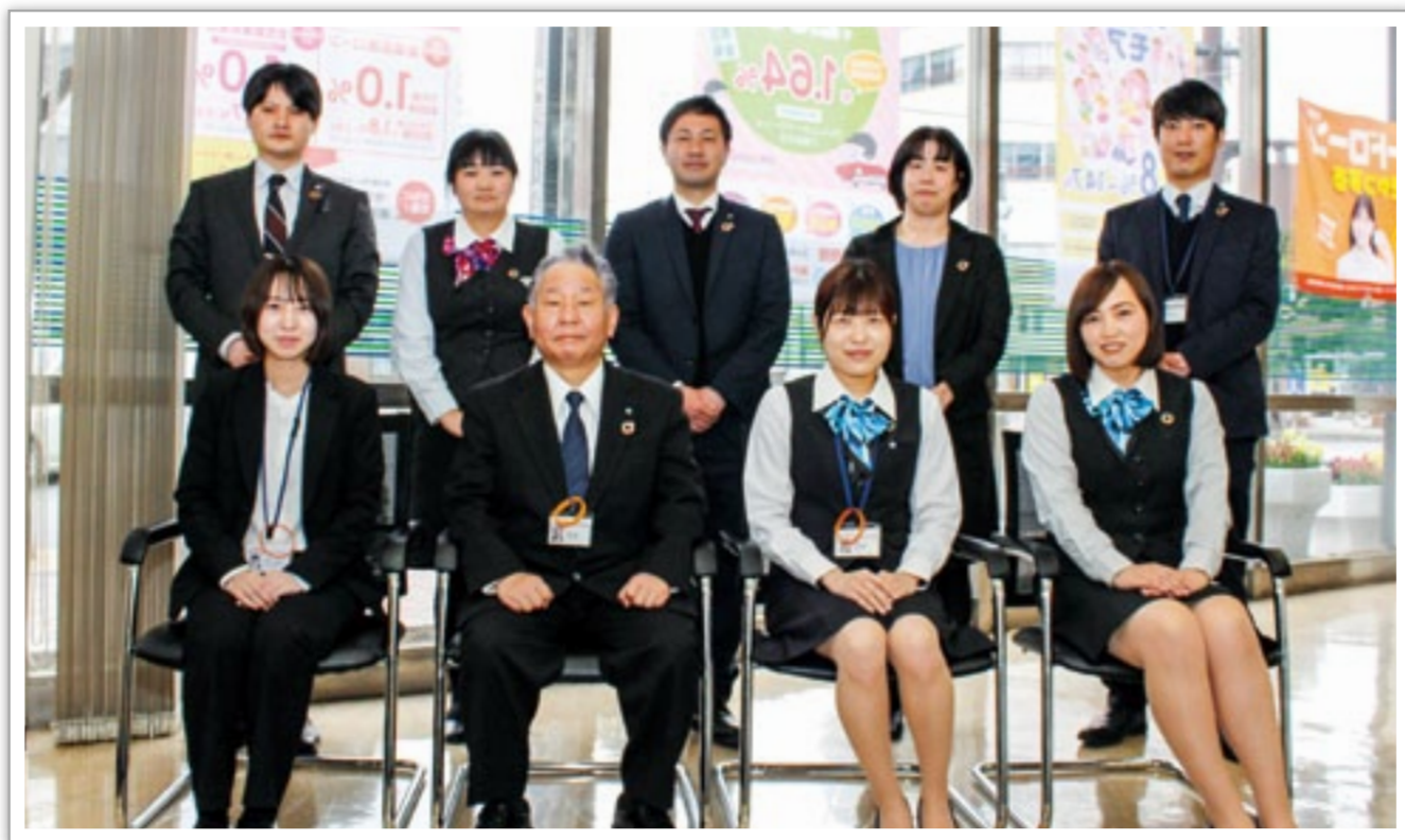
鶴崎支店の皆さん